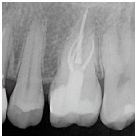
根管充填後のレントゲン写真