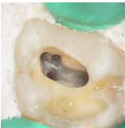
根管形成終了後の根管口部