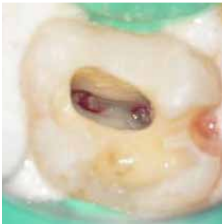
アクセスすると、髄腔が狭窄して根管口部が確認し難いことがわかる。