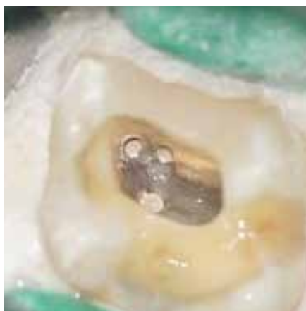
根管充填後の根管口部