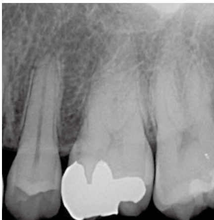
カリエス治療後に長期間冷水痛があり、症状悪化のため抜髄となった。